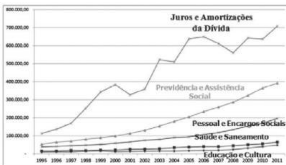
Gráfico 1- Orçamento geral da União – gastos selecionados (R$ milhões)

No entanto, na tentativa de conter os efeitos da crise, os últimos governos acabaram por investir uma pequena quantia em reajustes dos salários dos servidores federais e em maiores gastos sociais, mas, mesmo estas medidas consideradas anticíclicas demonstraram-se ineficazes e mínimas para os dias atuais. Ineficazes diante dos problemas sociais que a(s) crise(s) costuma(m) gerar, e assim tem sido, e mínimas, principalmente, ao se comparar o que os últimos governos têm gastado com o pagamento dos juros e amortizações da dívida, porque seu gasto com a área social tem sido pífio, como demonstrado no Gráfico 1: